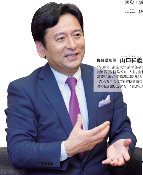
山口祥義 佐賀県知事 1989年、東京大学法学部卒業後、旧自治省(現総務省)に入省。危機管理、過疎問題などの職務に取り組み一方、多くの地方自治体でも経験を積み、官民交流でも活躍し、2015年1月より現職。