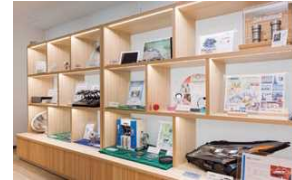
来賓室の入り口には「佐賀さいこう企業」表彰を受けた企業の素晴らしい製品を紹介するコーナーがある。ものづくりの高い技術力をアピールするのが狙い

日本大震災の際、ダウンしかけた首都圏のサーバーを佐賀オフィスで緊急対応して危機を回避できた事例もあるという。